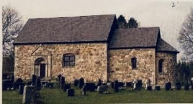
Gamla Hjälmseryds kyrka och gästhem

Om man kör bil är det väldigt lätt att hitta hit. Riksväg 30, vägen mellan Jönköping och Växjö, 7 km söder om Vrigstad. När du kommit in i Gamla Hjälmseryd ska man svänga mot Söndra, där är det också skyltat kulturminne och vandrarhem. 50 meter in på den vägen svänger man igen, åt höger, även denna gång är det skyltat kulturminne och vandrarhem. Då kommer man fram till vår och kyrkans parkering.